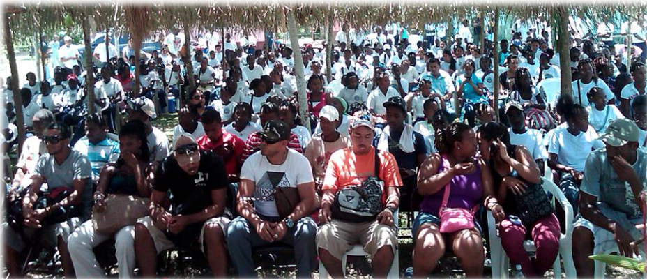
Los encuentros culturales permiten a los Garífunas para celebrar, fortalecer y reanimar sus prácticas culturales.

Juntos estos micro proyectos desarrollaran: El impulso de la ciudadanía y participación pública de la población infantil para la exigibilidad de sus derechos para impulsar la construcción participativa de la agenda social de la niñez como herramienta orientadora; el fortalecimiento de las capacidades de los titulares de derecho, las organizaciones y del gobierno territorial para mejorar las condiciones de vida de las familias; mejores habilidades, competencias y condiciones apropiadas para la atención oportuna y eficaz de la primera infancia; condiciones mejores de educación, alimentación y nutrición de los niños y niñas con prioridad; y mejor nutrición para las familias por diversificación, huertos y educación.