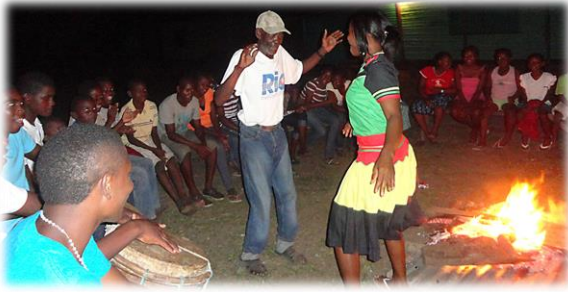
Una noche de actividades culturales Garifuna