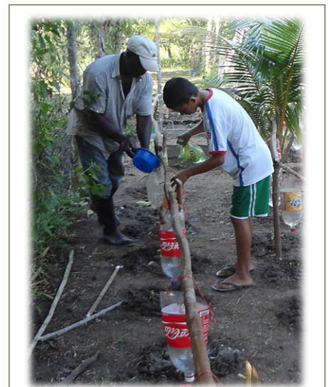
Riego por goteo, una buena práctica en huertos, reciclaje y el uso de agua