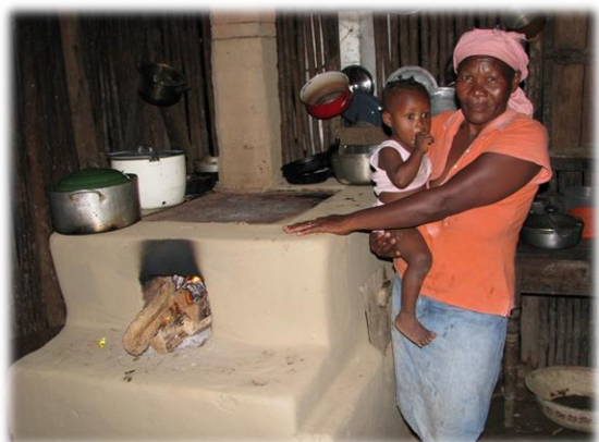
Los fogones mejorados reducen el uso de leña por 45% y mejoran la salud de familias.

Los 5 componentes del proyecto interactúan para efectuar cambios en participantes de baja auto-estima a actitudes y actividades con la potencialidad de transformar las vidas y comunidades y fortalecer las culturas de la Moskitia.