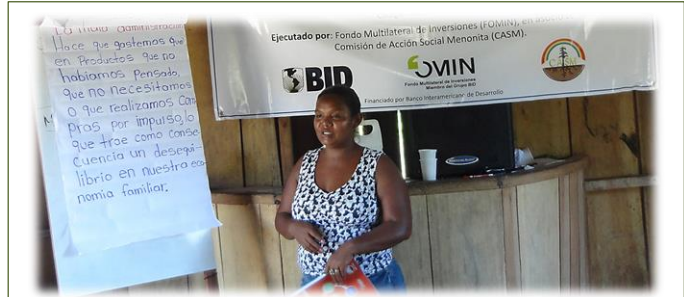
Los talleres son esenciales para la capacitación de la gente